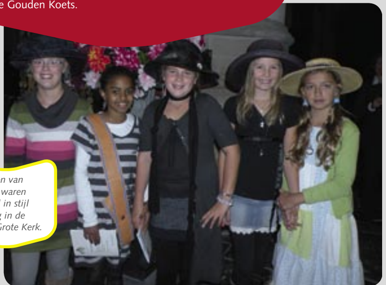
Leerlingen van De Rank waren helemaal in stijl aanwezig in de Haagse Grote Kerk.

Leerlingen van de groepen 8 van De Fontein, De Lisbloem en De Rank leverden op Prinsjesdag een bijdrage aan de landelijke gebedsbijeenkomst in de Grote Kerk te Den Haag. Deze bijeenkomst gaat vooraf aan de rijtoer van de koningin door de stad. De kinderen deelden voor de viering programmaboekjes uit, brachten genodigden zoals ministers en Kamerleden naar hun plaatsen en zongen tijdens de dienst het lied 'Halleluja' van Leonard Cohen. Na afloop stonden ze langs de route van de Gouden Koets.