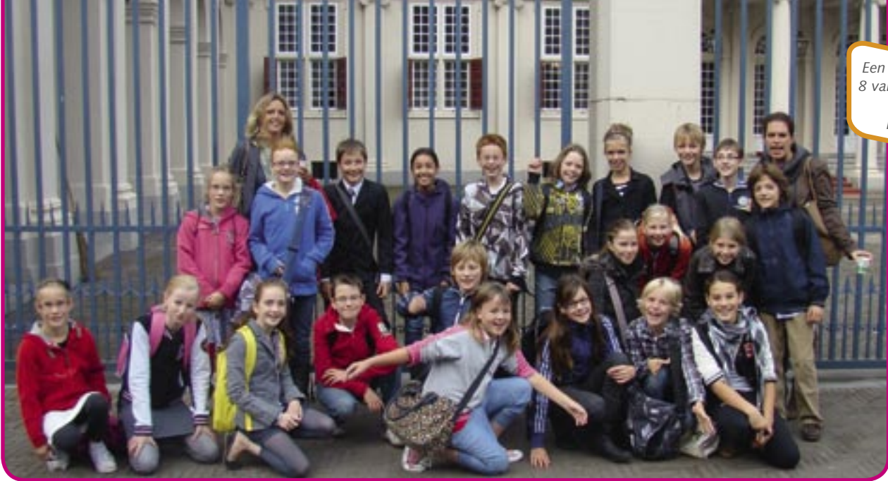
Een van de groepen 8 van De Regenboog voor paleis Noordeinde.