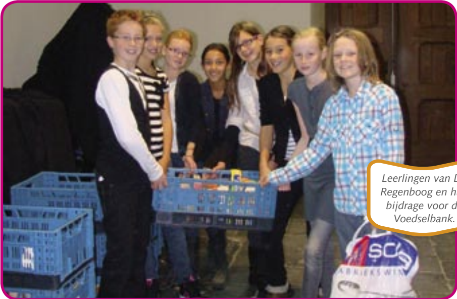
Leerlingen van De Regenboog en hun bijdrage voor de Voedselbank.

Drie groepen 8 van De Regenboog uit Voorhout werkten mee aan de landelijke interreligieuze bezinningsbijeenkomst op Prinsjesdag. De leerlingen deelden in de Grote Kerk van Den Haag programmaboekjes uit, ze werkten mee aan de collecte en zamelde pakken of blikken voedsel in voor de Voedselbank. Dit jaar was het thema van de bijeenkomst: 'Delen is helen'. De bijeenkomst wordt elk jaar bezocht door ongeveer duizend mensen, onder wie veel Kamerleden, ministers, staatssecretarissen en prominenten uit het bedrijfsleven en maatschappelijk middenveld. Na afloop keken de leerlingen op het Lange Voorhout naar de Gouden Koets.