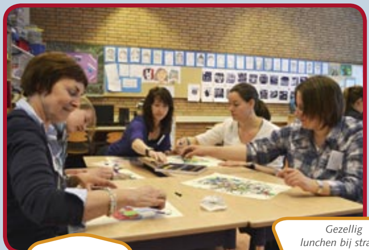
Docenten van Inholland verzorgden de workshop Kunst for kids.