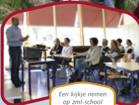
Een kijkje nemen op zml-school De Duinpieper.

'Voor elk wat wils is heel mooi, maar als een team kom je er niet veel verder mee. Maar dit hoeft misschien ook helemaal niet. Als het doel is 'ontmoeting en ontspanning', is dit gehaald. Als het doel is: als schoolteam beter worden in een bepaald onderwerp, is het niet gehaald.'