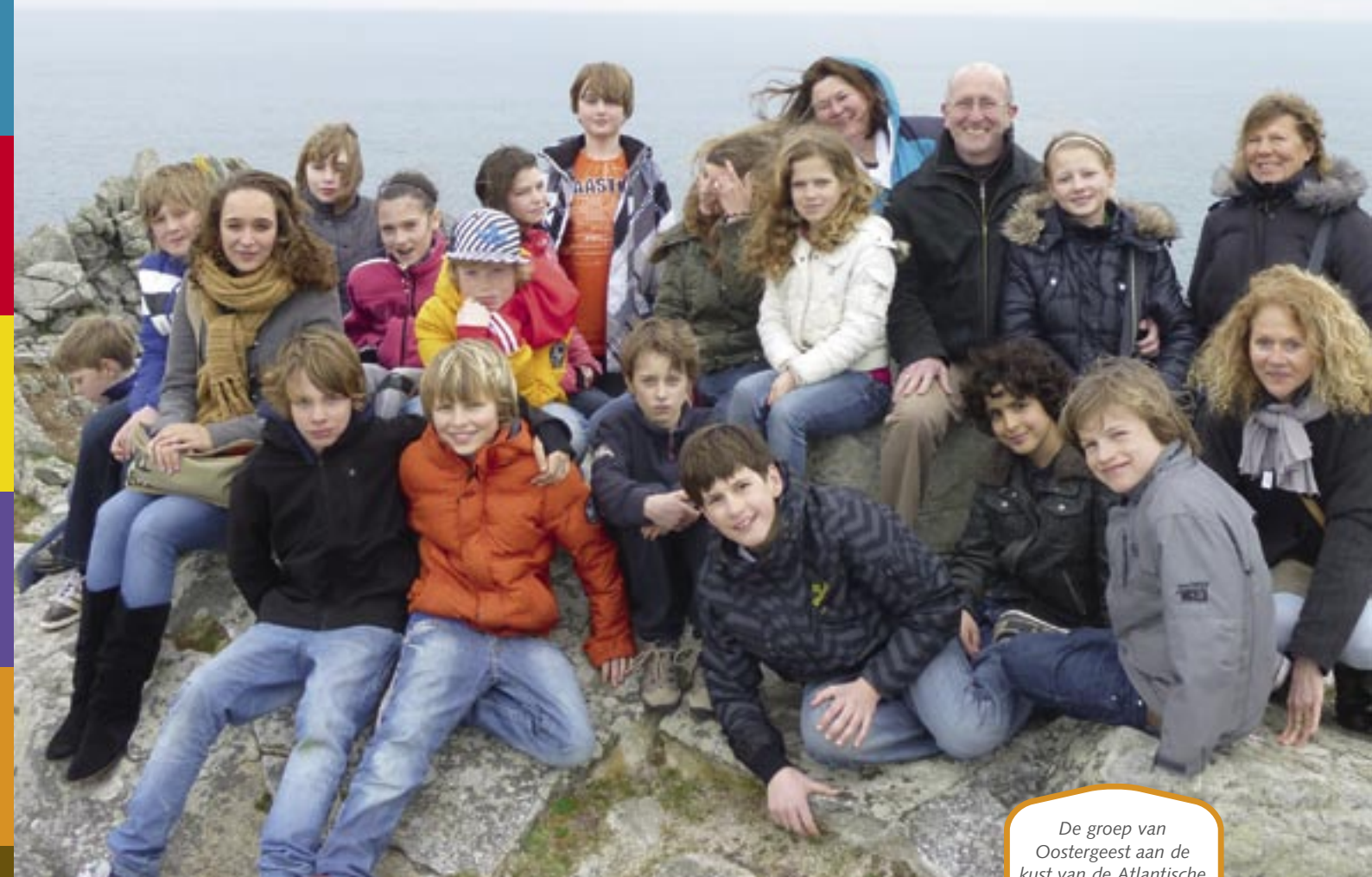
De groep van Oostergeest aan de kust van de Atlantische Oceaan.