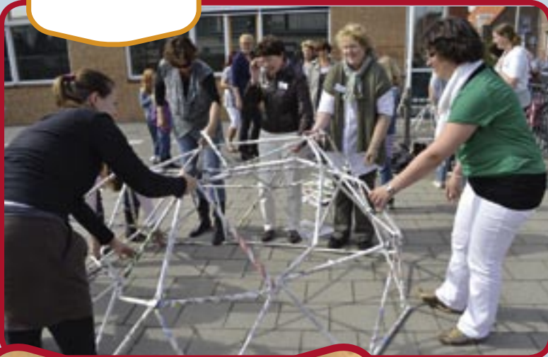
Techniekles voor juffen op het plein van Wakersduin.