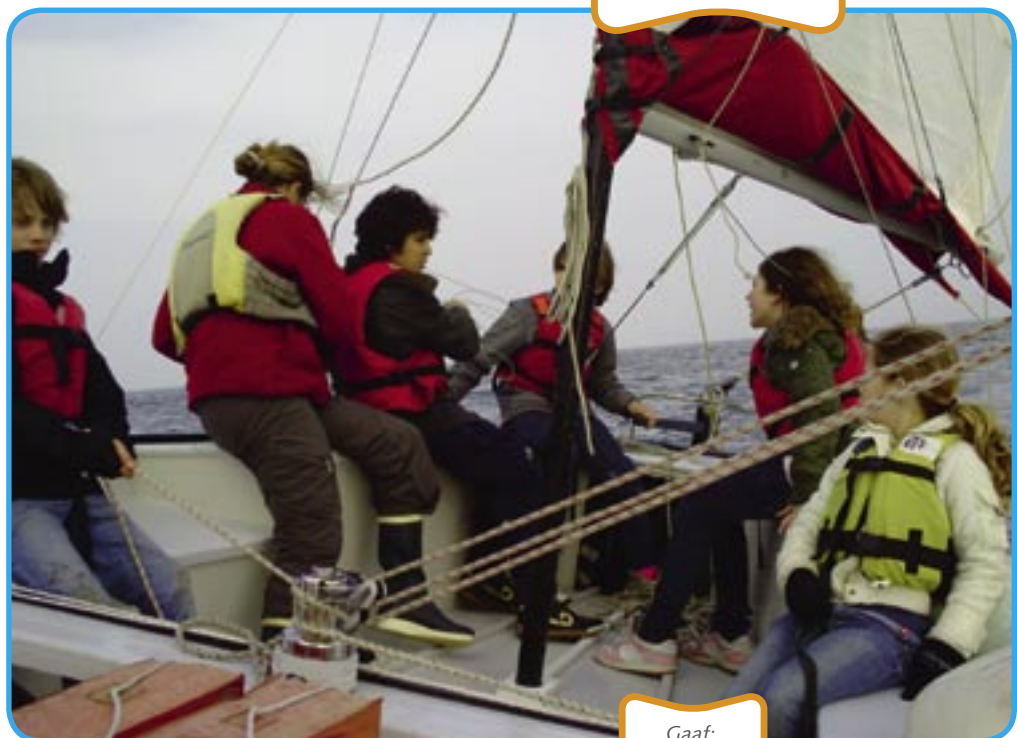
Gaaf: zeilen in de baai.

Ze werden in de plaats Douarnenez vier dagen lang ondergedompeld in het schoolleven van Franse leeftijdgenootjes. Ze bezochten onder andere een koekjesfabriek, woonden een vogelshow bij, en zeilden in de baai. Ook voerden ze gezamenlijk een toneelstuk op in het plaatselijke theater. Via Skype hadden ze tussendoor contact met hun school. Na terugkomst gaven de leerlingen een presentatie aan de andere klassen van Oostergeest.