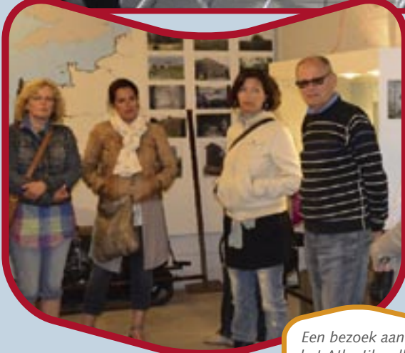
Een bezoek aan het Atlantikwall Museum.