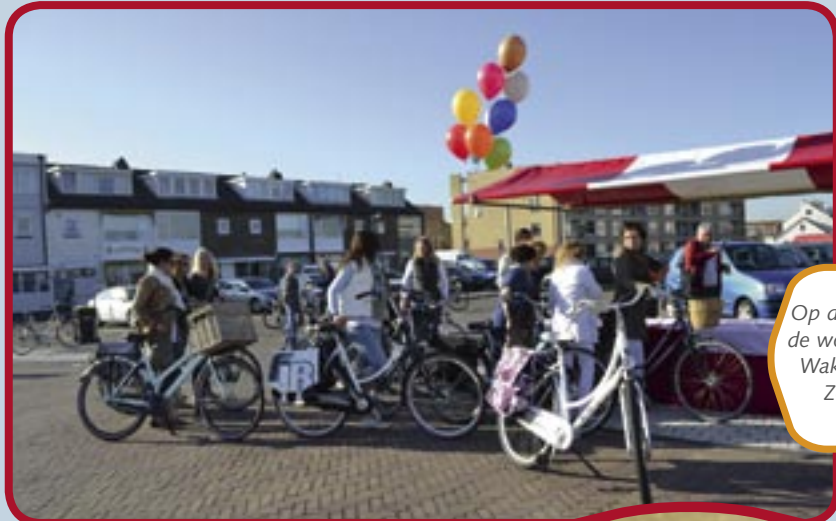
Excursie door het Leeuwenhorstbos.