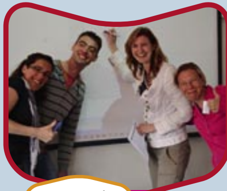
Interactief rekenen met het digitale schoolbord.