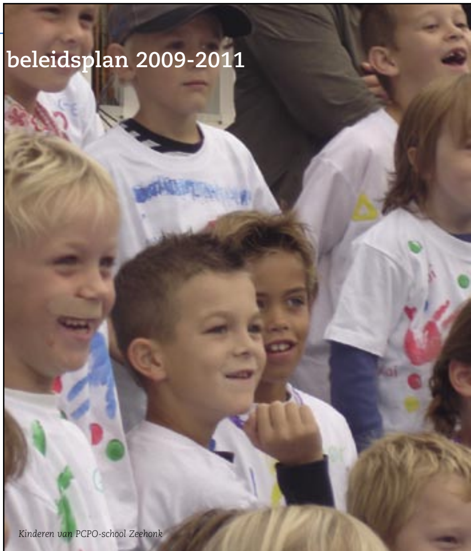
Kinderen van PCPO-school Zeehok

We streven ernaar om onderwijs aan te bieden dat volop kansen biedt voor een brede ontwikkeling. Daaronder verstaan we in ieder geval sport, cultuur en talen. In het kader van de brede-schoolontwikkeling willen we ook anticiperen op de maatschap-