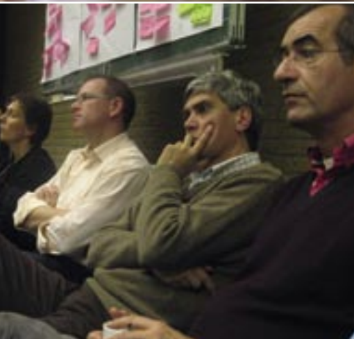
Bespreking van het concept-beleidsplan op 5 november.

pelijke tendens dat steeds meer kinderen opgroeien in situaties waarin beide ouders werken. Voor kinderen zullen dan volledige dagarrangementen beschikbaar moeten zijn in samenwerking met partners in de keten.